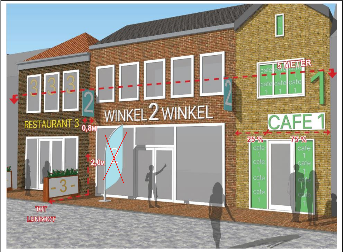
Uitgangspunten voor reclame-uitingen