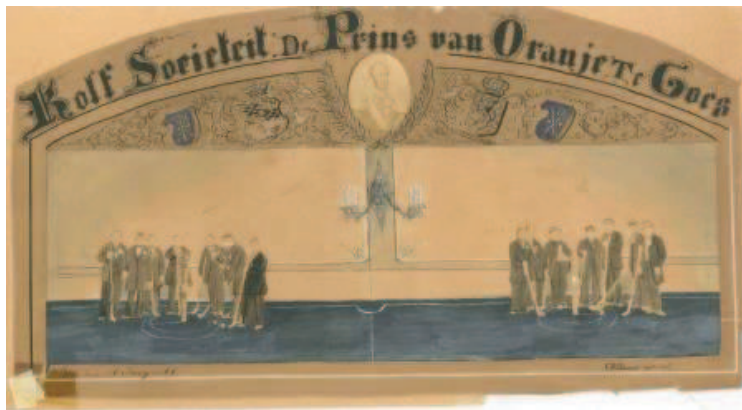
Afbeelding door C.W. Bauer, een combinatie van een fotocollage en schilderij, 10 juni 1866

De Duitser C.W. Bauer was fotograaf in Goes voordat hij zaken in Middelburg en Vlissingen opende. Hij had op verschillende plaatsen in de stad atelierruimte, o.a. in de Prins van Oranje aan de Nieuwstraat en in de Magdalenastraat.