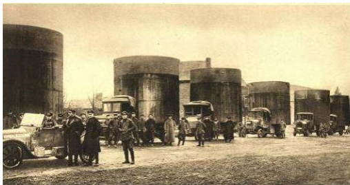
Tankauto's met de tank verticaal achterop

Toen in oktober 1914 de Duitsers Antwerpen met een beschieting probeerden te veroveren, zette een stoet van honderdduizenden Belgen zich in beweging in de richting van de grens met Nederland. Een groot deel van hen probeerde via Zeeuws-Vlaanderen de Westerschelde over te steken. Plaatsen met havens, zoals Waarde, Hansweert, Hoedekenskerke, Ellewoutsdijk en Vlissingen kregen tienduizenden vluchtelingen te verwerken. Geen van de gemeentebesturen was op een dergelijke humanitaire ramp voorbereid. In alle Zeeuwse plaatsen werden steuncomités opgericht om de vluchtelingen te verzorgen. Na een aantal dagen werden de meesten van hen doorgestuurd naar opvangkampen in de rest van Nederland.