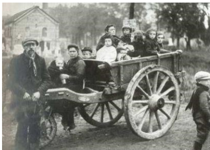
Vertrek uit leper

Toen in oktober 1914 de Duitsers Antwerpen met een beschieting probeerden te veroveren, zette een stoet van honderdduizenden Belgen zich in beweging in de richting van de grens met Nederland. Een groot deel van hen probeerde via Zeeuws-Vlaanderen de Westerschelde over te steken. Plaatsen met havens, zoals Waarde, Hansweert, Hoedekenskerke, Ellewoutsdijk en Vlissingen kregen tienduizenden vluchtelingen te verwerken. Geen van de gemeentebesturen was op een dergelijke humanitaire ramp voorbereid. In alle Zeeuwse plaatsen werden steuncomités opgericht om de vluchtelingen te verzorgen. Na een aantal dagen werden de meesten van hen doorgestuurd naar opvangkampen in de rest van Nederland.