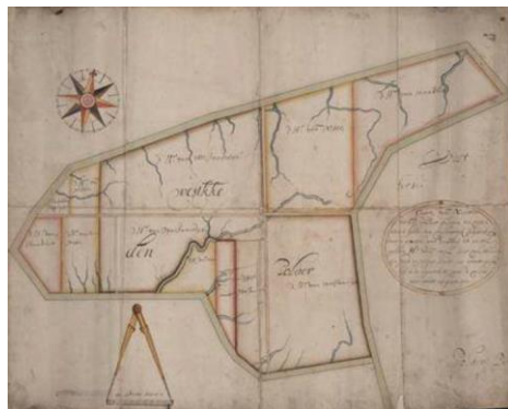
De Westkerkepolder in 1699.

Lodders onderzoek gaat terug tot ongeveer 1600. De stamvader die hij gevonden heeft, is de landbouwer Cornelis van Strien, geboren 1601 en overleden 1673, vermoedelijk te Yerseke. Zijn zoon Hendrik Corneliszn van Strien, geboren omstreeks 1637 te Yerseke, was de eerste van deze familie die zich in 1670 als landbouwer vestigde te Wolphaartsdijk. Hij was schepen van Wolphaartsdijk en gezworene van de polder van Oud-Wolphaartsdijk tussen 1674 en 1685 en dijkgraaf van de Westerlandsepolder tot 1686. Hij wordt beschouwd als de stamvader van alle Van Striens geboren of afkomstig van Wolphaartsdijk. In het archief van de gemeente Reimerswaal waaronder Yerseke valt, heeft Lodder overigens niets over Cornelis kunnen terugvinden. In rechte lijn van zijn afstamming komt Hans Lodder drie dijkgraven Van Strien tegen: Hendrik Corneliszn (*1637- †?) en J. Hendrikszn(*1657- †1731) van de Westerlandsepolder en Hendrik Janszn (*1686- †1754) van de Westkerkepolder.